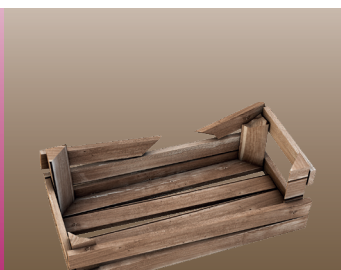
Опаковки от дърво