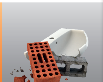
Строителни и ремонтни отпадъци