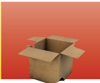
Опаковки от картон