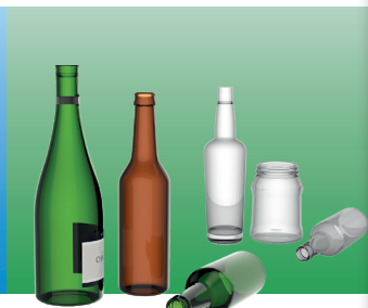
Бяло стъкло; Цветно стъкло